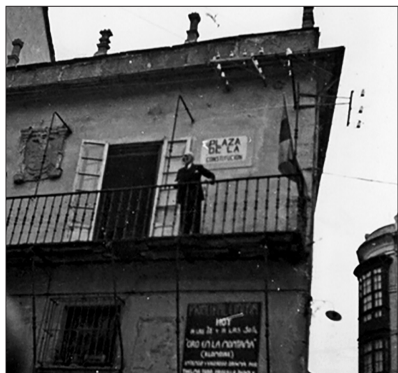
Cándido Carreiras fala desde o balcón do antigo consistorio.