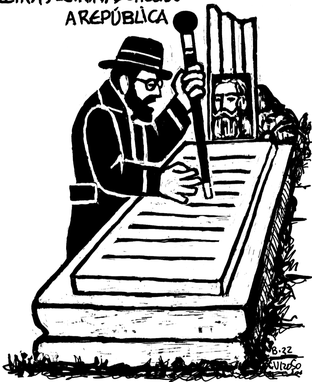
Ilustración de Xosé Vizoso.

O colectivo Memoria da Mariña xunto con varios veciños e veciñas de Mondoñedo promoven unha homenaxe a este mindoniense esquecido, coincidindo co 75.º aniversario do seu pasamento.